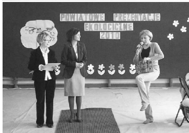
Taniec ekologiczny, Pani Dyrektor...?