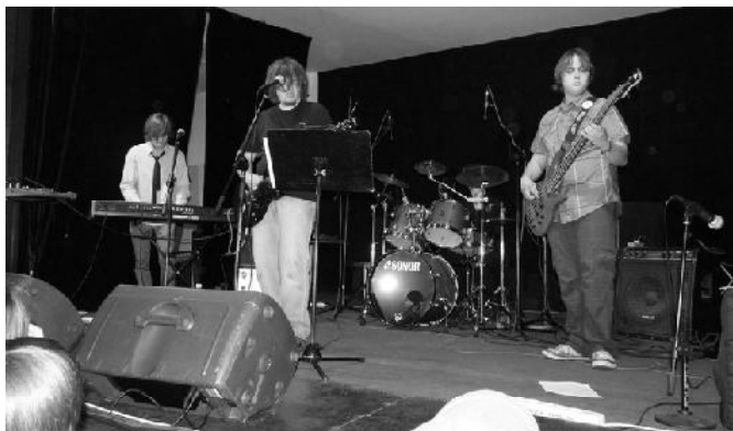
OSB - obiekt westchnień fanek...

W imprezie wzięło udział pięć grup muzycznych: ECSAPE, ZESPÓŁ TYMCZASOWY No. 213, OSB i AERO z Prabut oraz gościnnie kwidzyńska formacja SITESLIGHT. Goście koncertu mogli wysłuchać urozmaiconego repertuaru w stylu rock, metal, progressive pop i rock. Warto zaznaczyć, że doświadczony już zespoły AERO i SITESLIGHT koncertują w klubach stolicy i północnego obszaru kraju, promując nasz powiatowy świątek muzyczny. Ciekawostką przeglądu był debiut artystyczny młodej, obiecującej grupy ZESPÓŁ TYMCZASOWY No. 213, która od kilku miesięcy szlifuje swój warsztat muzyczny w pracowni MGOK. Kolejna edycja ANTY- BIT FEST planowana jest na przełomie lipca i sierpnia a ambicją organizatorów jest wzbogacenie formuły przeglądu o udział w nim zespołów z innych sąsiednich ośrodków. MS