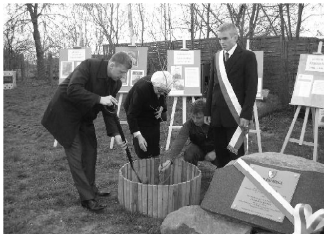
Sadzenie „Dębu Katyńskiego”