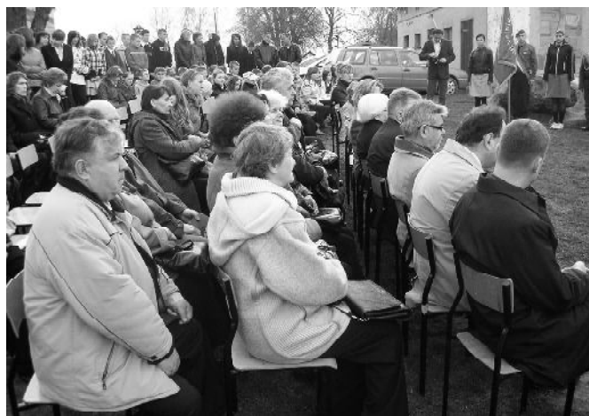
Pełna plenerowa widownia