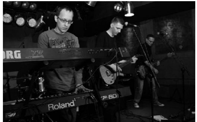
Zespół AERO podczas koncertu w warszawskim klubie Remont.