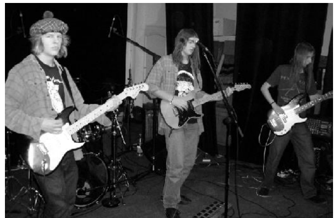
Suska grupa „Sto Lat w Szopie”