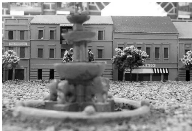
Makieta jest dopracowana w szczegółach...prawda?