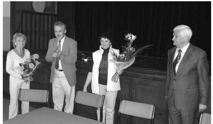
Kwiaty dla Panów Marszałków na powitanie...