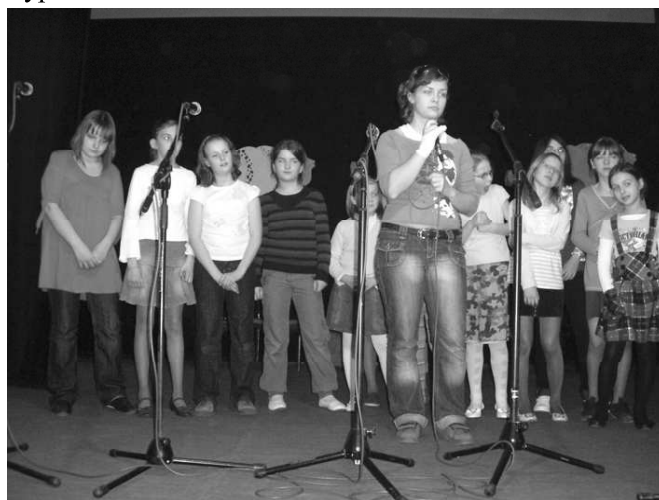
Degustację urozmaicały zespoły „Belferek” i „Elfy”

Organizator imprezy, MGOK serdecznie dziękuje wszystkim Paniom, zaangażowanym w pokaz, za ogromny wkład pracy i kulinarny talent. Pierwszy, a więc zapewne nie ostatni Prabucki Stół Wielkanocny był nadzwyczaj udanym przedsięwzięciem i, ośmieleni powodzeniem planujemy zorganizowanie Powiatowego Stołu Wigilijnego. Mamy nadzieję, że nasze mistrzynie sztuki kulinarnej nas nie zawiodą.