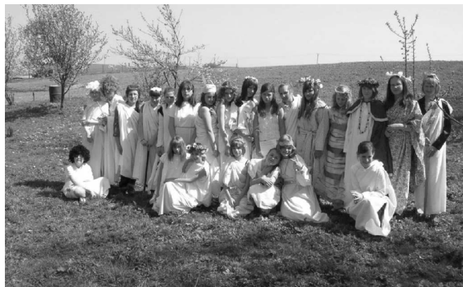
Greckie nimfy w plenerze (szkoda, że nie widać tego w kolorze...)