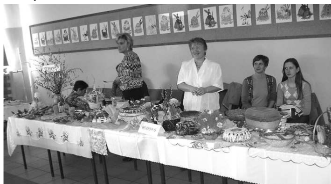
Sypanica i Rodowo