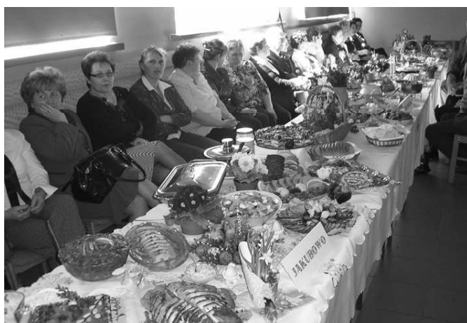
Jakubowo, Trumiejki, „Belferek” i Gonty