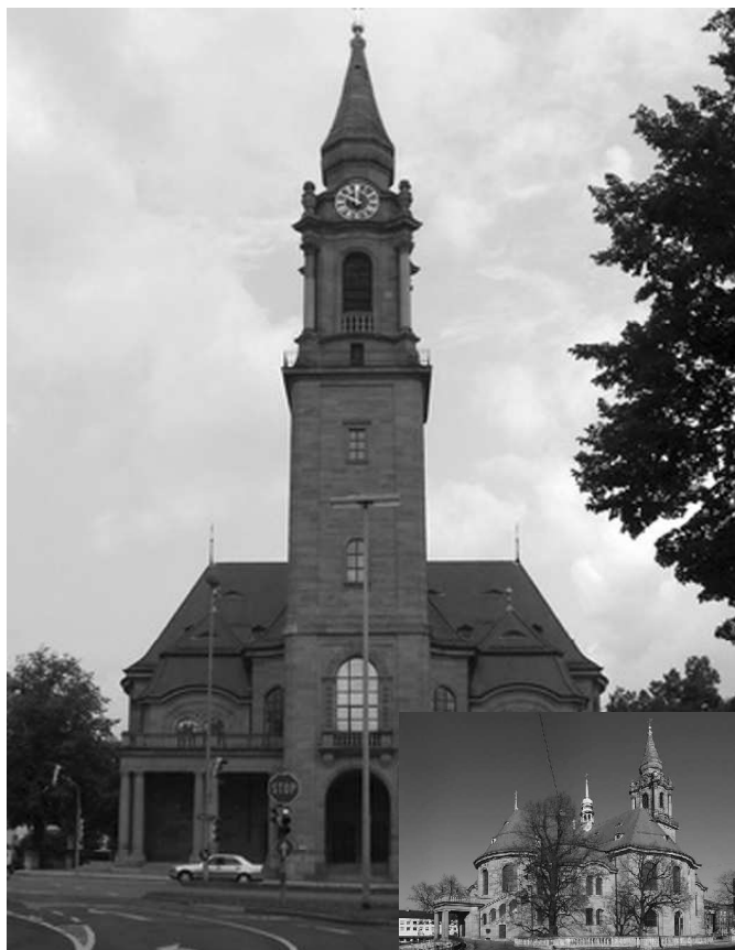
Kościół Pokoju w Ludwigsburgu, gdzie znajduje się dzwon z prabuckiej konkatedry.

W 2004 r. wrócił do Polski „pożyczony dzwon” do parafii w Leśniewie Wielkim (miejscowość koło Zielonej Góry), który został skonfiskowany w 1942 r., a przez 40 lat dzwonił w kościele Św. Bonifacego w Wittmund. Zwrot tego dzwonu był pięknym gestem i przykładem dla innych parafii w których brzmią obce dzwony.