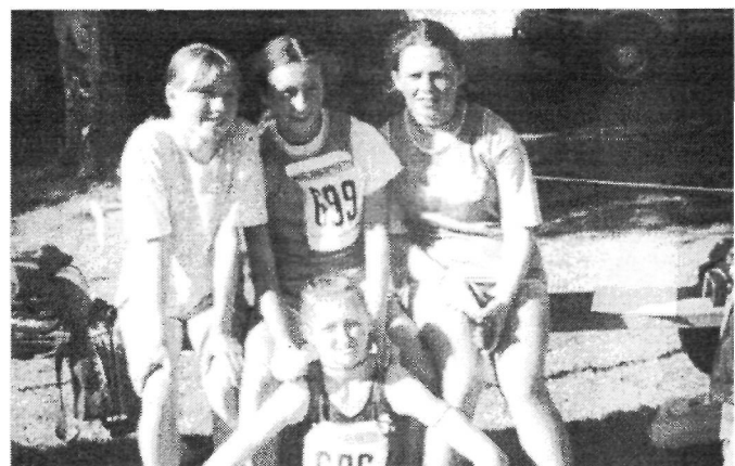
Nasze znakomite biegaczki w Szwecji (inf. na str. 6)