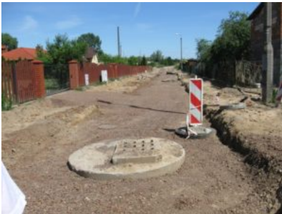
Przebudowa ulicy Pustej w Prabutach