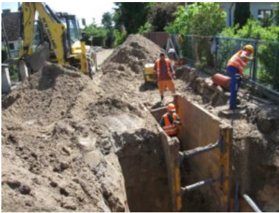
Przebudowa ulicy Pustej w Prabutach