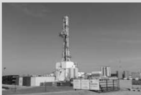
Gaz łupkowy w Pilichowie str. 6