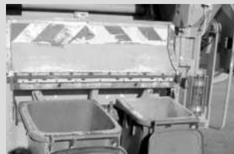
System gospodarowania odpadami komunalnymi str.7-8