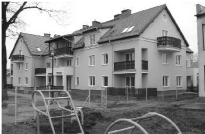
A tak dzi ...ładny domek, prawda?

Gmina Prabuty miała swój udział w przedsi wzi - ciu kwidzy skiego Towarzystwa Budownictwa Społecz- nego. Przekazano inwestorowi teren i sfinansowano koszt dozoru. W najbli szym czasie TBS zacznie (i zapewne równie szybko sko czy) budow drugiego budynku, o po- łów mniejszego, dla 12 rodzin, który stanie na terenie pomi dzy ul. Obro ców Westerplatte i Kisielick , nieop- dał bloku Jagiełły 2. Ł czna warto udziału gminnego bu- d etu w obu inwestycjach mieszkaniowych szacuje si na kwot około 1,5 mln zł. Wysoko czynszu w nowo odda- wanym bloku TBS okre la si w granicach 10,50 zł za metr kwadratowy (z ogrzewaniem i u rednionym zu- yciem wody i energii elektrycznej). Zatem za 50 metrowe mieszkanie koszt nie przekroczy 600 zł. A lokale s naprawd o wysokim standardzie, o czym mogłem si prze- kona , obserwuj c prace wyko czeniowe we wn trzu. Tyko budowa i zasiedł , o ile gmina znajdzie dalsze rodki na wspomo enie inwestora... M.S.