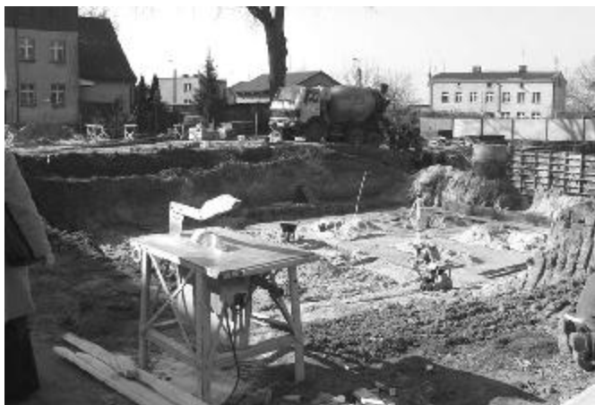
Tak wygl dał teren budowy w kwietniu b.r.

Trwają ostatnie prace kosmetyczne w budynku TBS przy ul. Mickiewicza. Obiekt, w którym zamieszkać 22 rodziny wybudowano w ekspresowym tempie. Zarówno zewn trz, jak i w rodku nie ma czego wytkn wyko- nawcy, iławskiej firmie IPB. Jeszcze przed wi tamii bu- dynek zostanie zasiedlony, we wtorek, 18 grudnia nast pi jego uroczyste otwarcie.