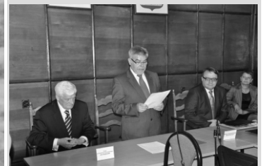
Nadanie tytułów Honorowych Ambasadorów Prabut str. 4

19:00 - koncert WIRUS 20:00 - koncert RAGGABANGG 21:00 - koncert OLSEN & FU 22:30 - zakończenie imprezy