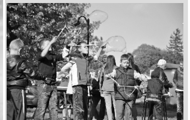
Majówka z PCKiS str. 7