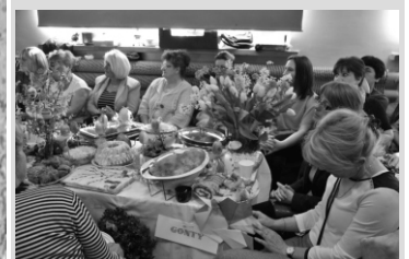
Fotorelacja Gminny Stół Wielkanocny str. 6-7

jezioro Sowica przystań wędkarska godz. 7:00 zawody wędkarskie spławikowe o mistrzostwo koła PZW Prabuty (tylko dla członków koła PZW Prabuty)