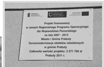
10 lat Prabut w UE - dodatek