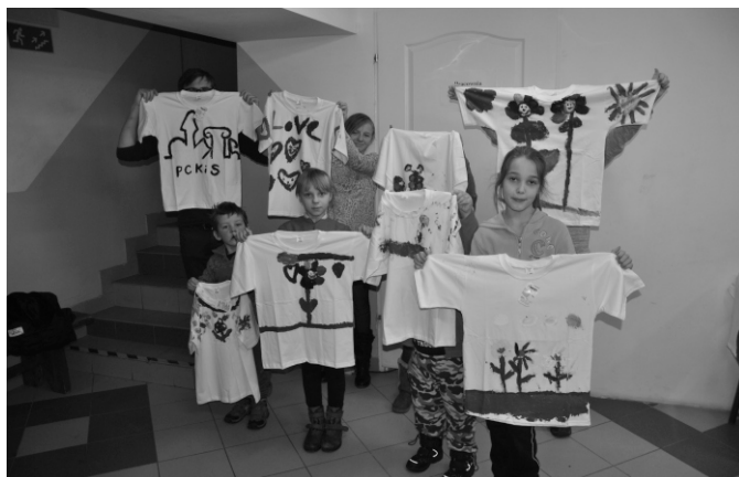
Młodzi projektanci mody i ich trendy na sezon wiosna - lato 2014.