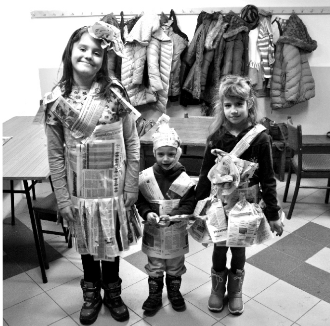
„Dizajn z odzysku” czy też „gazetowa moda”. Najnowsze trendy na sezon wiosna - lato 2014 :)...