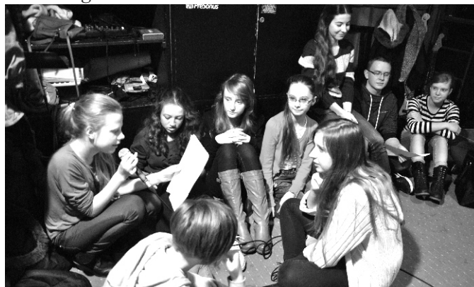
Pękająca w szwach pracownia muzyczna podczas warsztatów muzycznych.