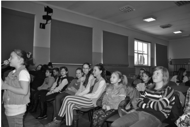
... konkurs karaoke talentów wokalnych...