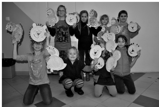
Efekty zajęć plastycznych - lwy i dinozaury z jednorazowych tacek...