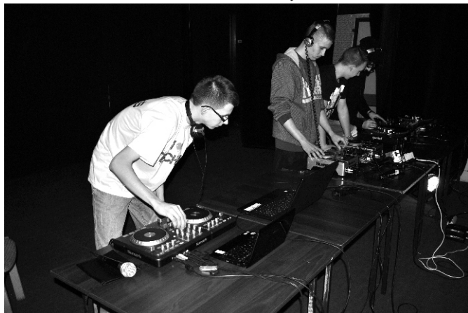
... energetyczne potyczki Dj'ów.