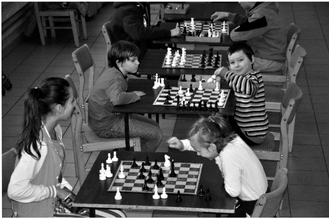
Otwarte zajęcia warszabowo - szachowe...