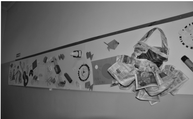
Fragment imponującego kolażu, podsumowującego zajęcia w Prabuckim Centrum Kultury i Sportu.