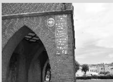
Wieści z Ratusza str. 7-9