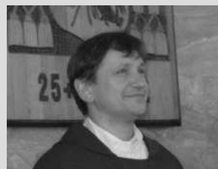
100 dni proboszcza str. 10-11