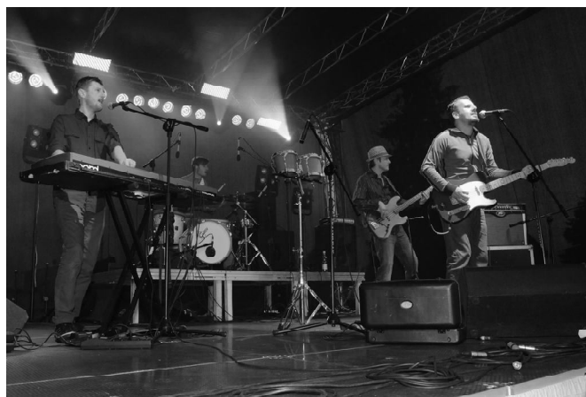
KASA i tyle..