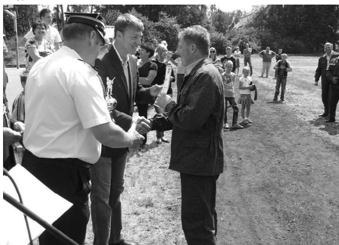
Na zakończenie zawodów wręczono odznaki wysługi lat dla członków jednostek, dyplomy oraz puchary.