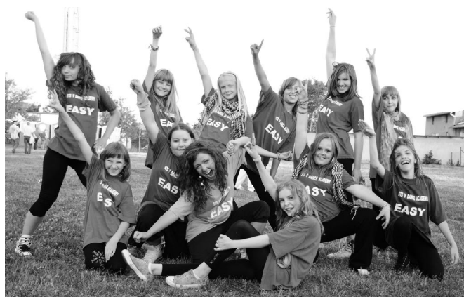
Nasze ekspresyjne tancerki - zespół „Easy”