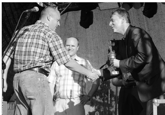
Wyróżnienia dla hodowców gołębi