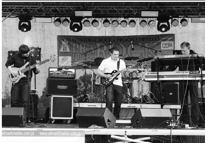
Zespół „Logic Mess” na festiwalowej scenie