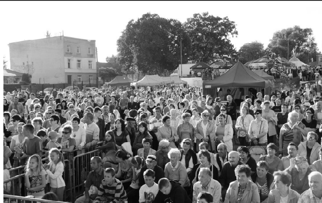
Naprawdę sporo nas było...