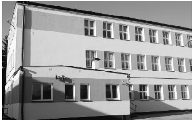
Ocieplony i pomalowany budynek SP2

W kolejnym roku na poprawę ogólnie pojętej infrastruktury w mieście i gminie oraz na zakupy sprzętu wydatkowano blisko 2,2 mln zł. Znaczną część tej kwoty pochłonęła termomodernizacja budynku SP2 (816.077zł) oraz przebudowa przyszkolnego placu (168.473zł). Zakupiono także udziały w TBS (147.293zł). Nasz udział w zakupie samochodu do przewozu osób niepełnosprawnych dla MGOPS wyniósł 45.000zł. Przebudowa chodników przy ul. Warszawskiej, Kraszewskiego, Kuracyjnej i Mickiewicza oraz parkingu przy ul. Sanatoryjnej kosztowała łącznie ponad 100 tys. zł. Inwestycje związane z infrastrukturą komunalną to: kanalizacja sanitarna ul. Krótkiej i Miłej (ok. 54 tys. zł), kanalizacja deszczowa ul. Mickiewicza (ok. 71 tys. zł), wodociąg - ul. Sanatoryjna (89,5 tys. zł), wymiana oświetlenia ulicznego w centrum miasta (27,5 tys. zł). Na placu przy ul. Legionów wykonano t.zw. skate park (29,5 tys. zł). Środki przeznaczone na drogę Obrzynowo - Jakubowo to suma 120 tys. zł. Zlecono również szereg dokumentacji projektowych i studium wykonalności na m.in. rozbudowę stacji uzdatniania wody, wodociąg ul. Czarneckiego, przebudowę skrzyżowania dróg 521/522 (dziś już rondo), adaptacji nowej siedziby biblioteki publicznej, odnowę wsi Rodowo i Gdakowo.