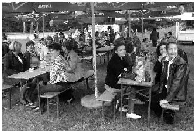
...a rodzice popijali...soki i wodę mineralną ?!