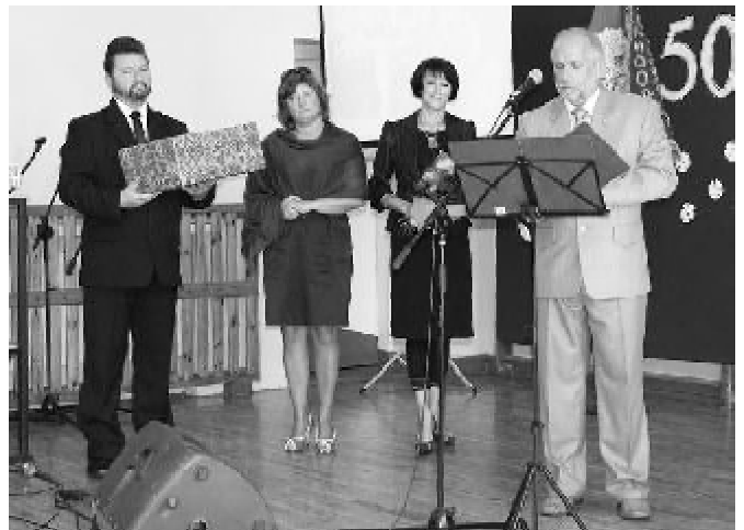
Życzenia od burmistrza i dyrektorów szkół