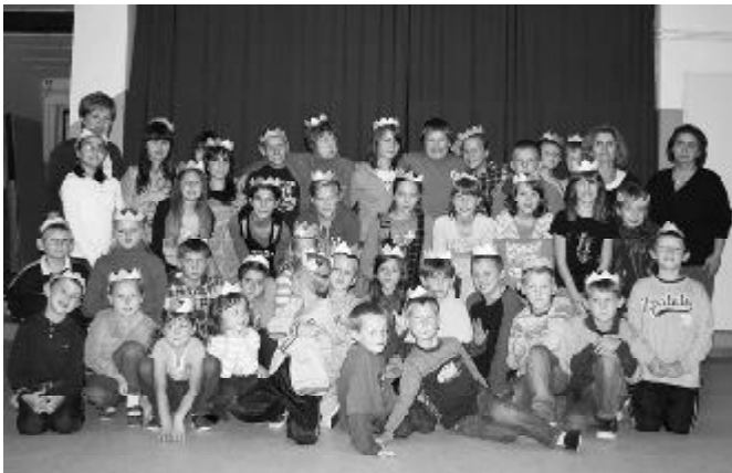
„Ukoronowani” uczestnicy warsztatów

Oryginalność zajęć polegała na improwizowanych inscenizacjach znanych bajek, wykonywanych przez wyłonione 6 osobowe grupy aktorów. Jak wynika z relacji autorek pomysłu, rezultaty warsztatowej zabawy przeszły ich najsmielsze oczekiwania. Projekt zrealizowano przy wsparciu Akademii Rozwoju Filantropii w Polsce i Lokalnej Fundacji Filantropijnej Projekt „Działaj Lokalnie” z Kwidzyna. Organizatorki zapowiadają kolejne edycje zajęć warsztatowych typu.