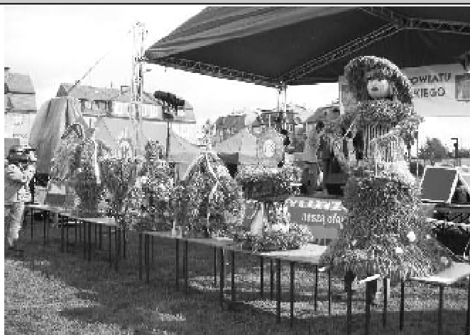
W konkursie wieńców dożynkowych wzięło udział 7 prac, komisja składająca się z przedstawicieli wszystkich gmin najwyższej oceniła wieniec z Okrągłej Łąki (drugi z prawej)