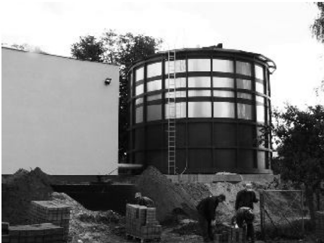
Budowa Stacji Uzdatniania Wody

Bieżący rok pod względem inwestycji będzie rekordowy, bowiem harmonogram prac inwestycyjnych obejmuje budowę kanalizacji sanitarnej (etap I) za kwotę blisko 4 mln zł oraz rozbudowę Stacji Uzdatniania Wody za sumę ponad 3,8 mln zł. Kwotę 1,3 mln zł zaplanowano na budowę sali gimnastycznej przy Zespole Szkół w Trumiejkach. Bieżące zaawansowanie prac w przypadku dwóch pierwszych inwestycji oceniane jest na 60-70%.