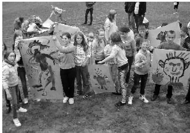
Dzieci malowały wymyślne potwory...