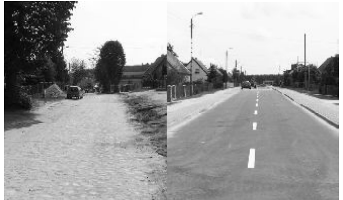
Ul. Chodkiewicza - jak było i jak jest...

Kolejną inwestycją, w tym przypadku zrealizowaną w porozumieniu z powiatem kwidzyńskim i przy udziale powiatowych środków była modernizacja a właściwie gruntowna przebudowa ul. Chodkiewicza. Udział budżetu gminnego w tym przedsięwzięciu wyniósł nieco ponad 1 mln zł, co stanowiło ponad 25% kosztu całej inwestycji, realizowanej w ramach Narodowego Programu Przebudowy Dróg Lokalnych (t.zw. „schetynówek”). Budżet państwa sfinansował ok. 50% kosztów a powiat pozostałą część.