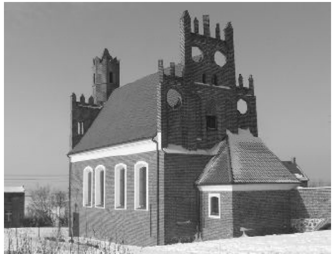
Kościółek w zimowej scenerii... Obecnie jest to miejsce ekspozycji wystaw i prac artystycznych.

W roku 2009 sfinalizowano remont Kościółka „Polskiego”, co znalazło uznanie Ministerstwa Kultury i Dziedzictwa Narodowego w ogólnopolskim konkursie „Zabytek zadbane”. Koszt remontu: 418.472 zł.