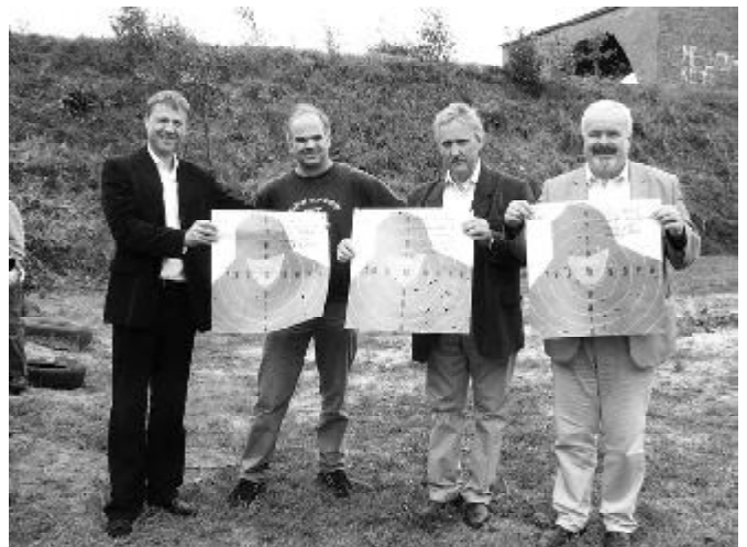
Takim wejść pod lufę to „kawalerka” na Parkowej ani chybi...