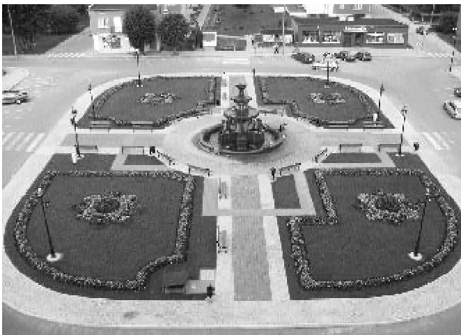
Prabuski Rynek po przebudowie

W pierwszym budżetowym roku kadencji wartość inwestycji zamknęła się kwotą około 2,1 mln zł. Znaczną część tej kwoty przeznaczono na wykup udziałów w budynku TBS (745.149zł), ostatnią transzę należności za budowę hali sportowej (592.525zł) oraz przebudowę Rynku w centrum Prabut (539.165zł).