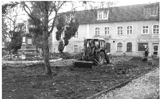
Prace na skwerze przy ul. Warszawskiej (c.d. na str.4-7)