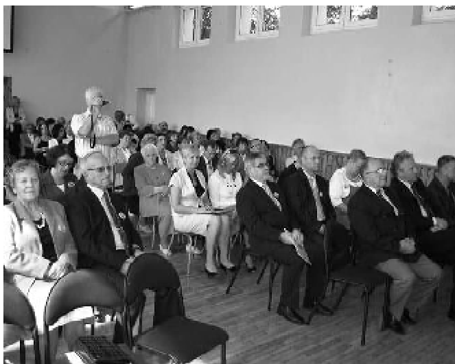
Salka ledwie pomieściła gości Jubilatki...