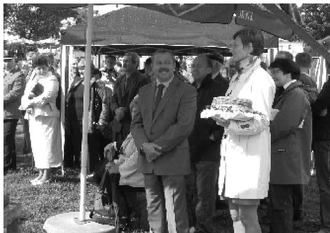
Starostowie dożynek z obrzędowym bochnem chleba

Wykonawcy części estradowej festynu wybrani zostali z uwzględnieniem charakteru imprezy i posiadanych środków. Mówiąc krótko, nie byliśmy rozrzutni. Mimo to zarówno oryginalny, grający na żywo zespół cygański „Hitano” jak i znany z przeboju „Żono moja” Masters przypadli do gustu publiczności. O godzinie 22 niebo rozświetliła całkiem udana ekspozycja fajerwerków, a około pół godziny później najbardziej wytrwali uczestnicy zabawy udali się do domów.