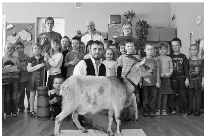
Środa, 24 marca