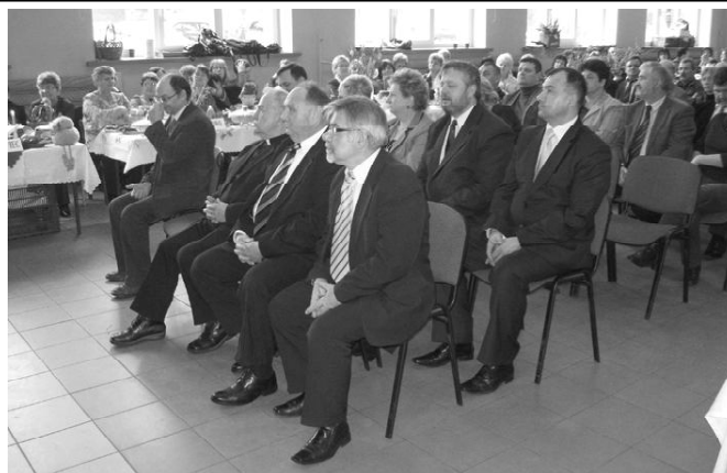
Trzeba było poczekać...