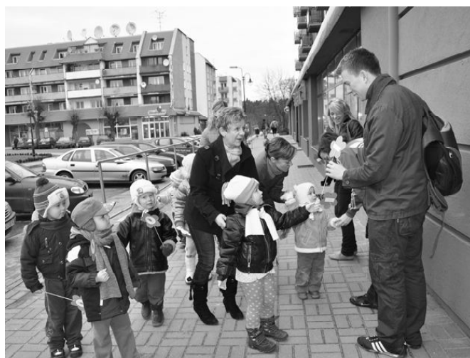
Poniedziałek, 22 marca

Ostatnie dni w przedszkolu „Bratek” obfitowały w wiele atrakcji. W poniedziałek, 22 marca przedszkolaki maszerowały ulicami miasta wręczając przechodniom wiosenne kwiatki - w ten sposób na dobre pożegnały zimę. Już we wtorek był „Dzień marchewki”, dzieci poznały tajniki zdrowego odżywiania i same przygotowały pyszny sok. A w środę przyjechali gospodarze z Lipna z programem edukacyjnym. Wspólnie z dziećmi robili twarożek i masło. Największą jednak atrakcją była obecność kozy Magdy i nauka jej dojenia. (inf. własna)