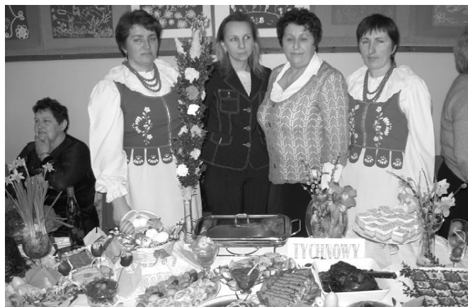
Tychnowianki w powiślańskich strojach