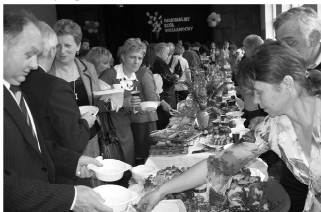
Samorządowcy przy stołach