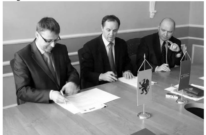
Finał umowy z Marszałkiem Mieczysławem Strukiem

22 marca burmistrz Bogdan Pawłowski podpisał umowę z Marszałkiem Województwa Pomorskiego na dofinansowanie budowy kanalizacji sanitarnej w Prabutach. Inwestycja obejmie swoim zakresem ulice: Zielną, Podgórną, Parkową, Wojska Polskiego, Koszarową, Górną i Rypińską. Z nowej kanalizacji skorzysta 565 mieszkańców. Wartość inwestycji wyniesie około 4 mln zł, z tego kwotę dofinansowania stanowi 1 291 000 zł, pozostała część zostanie pokryta z kredytu z Wojewódzkiego Funduszu Ochrony Środowiska. Wykonawcą robót zostało wyłonione w procedurze przetargowej Przedsiębiorstwo Inżynieryjne „Półwysep” z Redy. Inwestycja jest współfinansowana ze środków Unii Europejskiej w ramach Regionalnego Programu Operacyjnego dla Województwa Pomorskiego na lata 2007 - 2013.