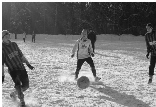
Mecz kontrolny Pogoni na zaśnieżonym jeszcze boisku sanatoryjnym.