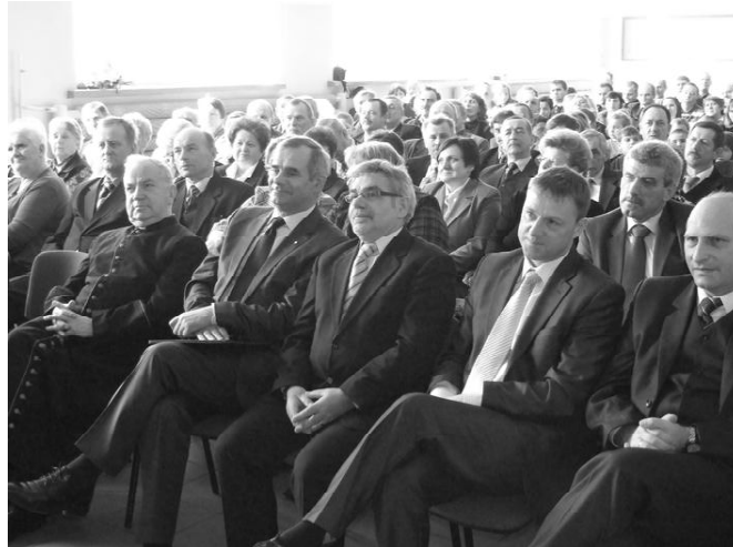
Oficjalni goście Jubileuszu