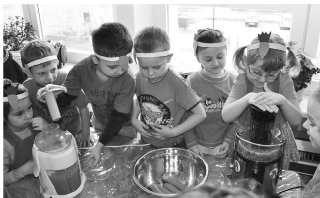
Wtorek, 23 marca