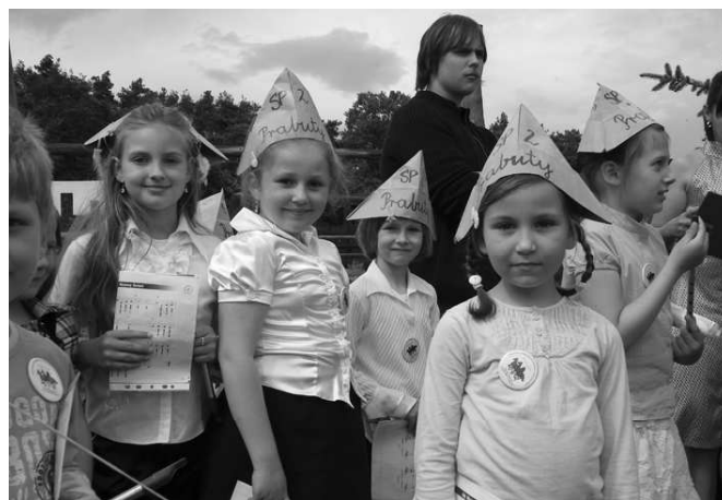
„Słoneczna Gromada” z SP2 przed występem