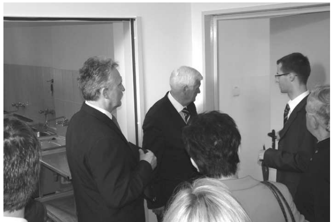
Zwiedzanie nowo urządzonych obiektów, Panowie Marszałkowie sprawdzają, na co dali kasę...