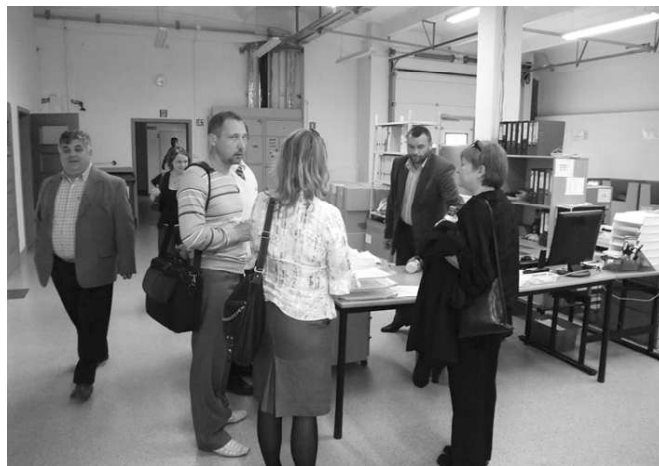
Zwiedzanie „Wega Electronics”