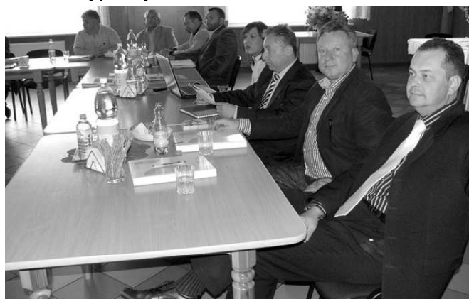
Uczestnicy spotkania podczas warsztatów