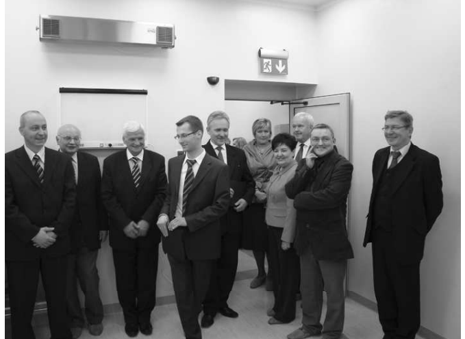
Zadowoleni ofiarodawcy i beneficjenci...