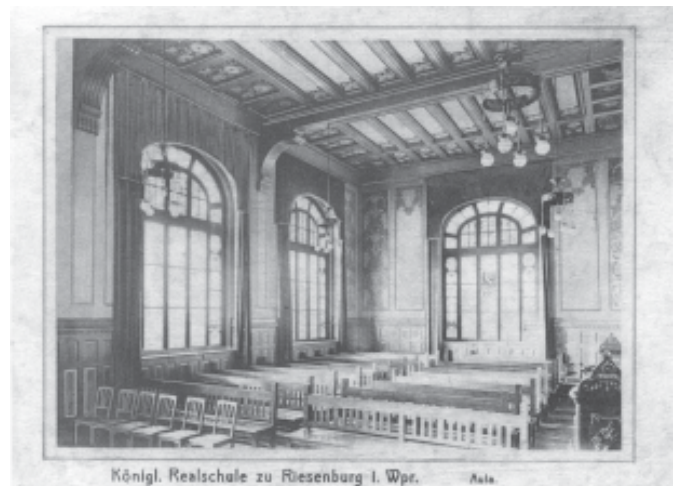
Königl. Realschule zu Riesenburg i. Wpr. A. 14