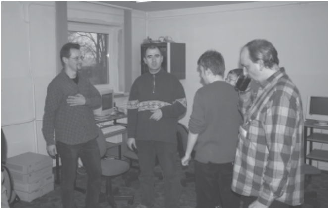
Grupa zawodników przed rozgrywkami finałowymi.

Tym razem mam zamiar podzielić się z Państwem moją skrzętnie dotąd ukrywaną pasją. Otóż od wielu lat jestem miłośnikiem starych, kultowych gier strategicznych. Do niedawna grałem jedynie z komputerem, dopóki nie znaleźli mnie w wirtualnej przestrzeni internetu inni, podobni fanatycy. Okazało się wówczas, że wstydlive upodobanie (w co on gra, w jakieś bitwy i wojny, stary byk?!) może być prawdziwie przyjemną zabawą, gdy włączą się do niej inni. Ku memu zaskoczeniu w Polsce funkcjonuje całkiem pokaźna grupa zawodników, zorganizowana w lidze i rozgrywająca mistrzostwa Polski. I, i dziwo, w Panzer General I i II, bo o tej grze m.in. mowa, grają dojrzały ludzie, często biznesmeni, nauczyciele, studenci, informatycy. Małoletni zawodnicy są tu rzadkością. Debiutując w mistrzostwach doszedłem do 1/8 finału i musiałem uznać wyższość dużo lepszych ode mnie strategów z Warszawy, Torunia, Lublina. Miałem za to prawdziwą przyjemność brać udział w zjeździe miłośników gry, który odbył się w Borach Tucholskich w malowniczej miejscowości Lipinki.