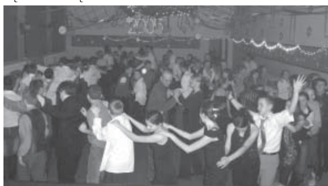
A to prawdziwy bal gimnazjalistów. Kulturalnej zabawy uczyć się za młodu...