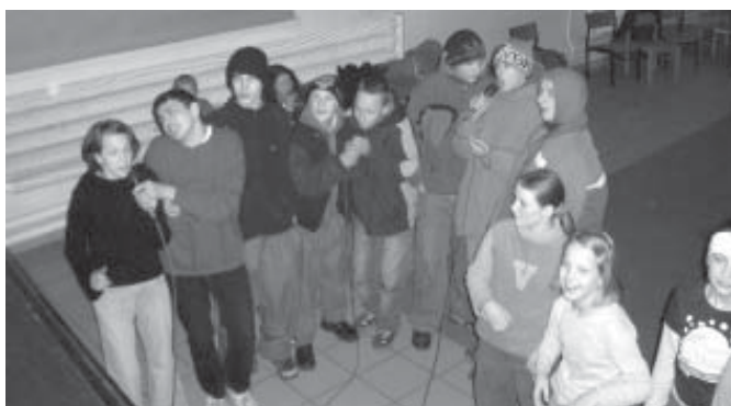
Konkurs karaoke w sali MGOK