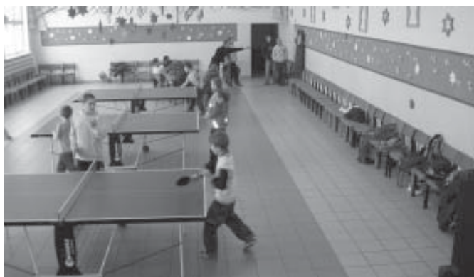
Codziennie tenis stołowy (z tyłu turniej darta)