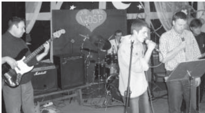
Śpiewaliśmy i graliśmy wszyscy...