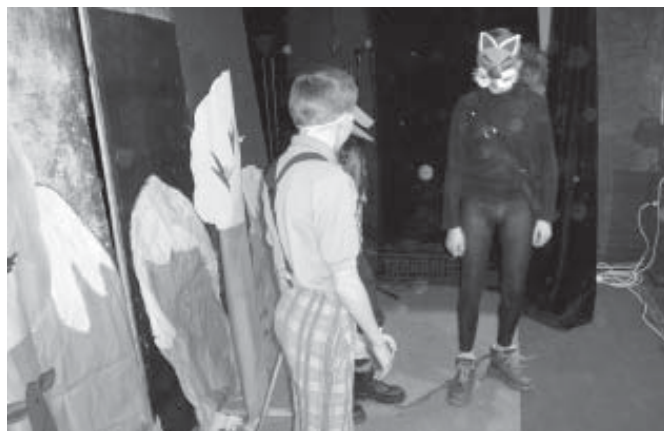
Impreza w MGOK zaczęła się od spektaklu teatryku szkolnego z ZS Rodowo. Na scenie Pinokio z Kotem...