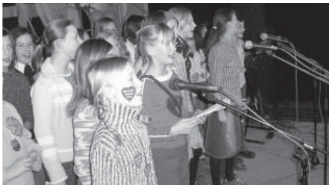
...zespół wokalny SP 2...