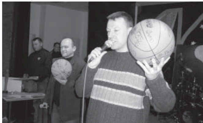
Licytacja piłek „Polfarmy” i „Basketu”