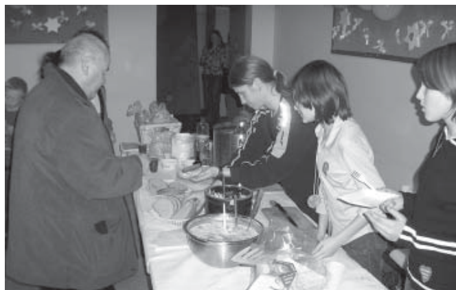
Panie Jacku, chleb ze smalcem i ogórkiem?