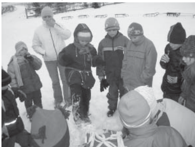
Nie było śniegu w ferie, robimy kuligi teraz...