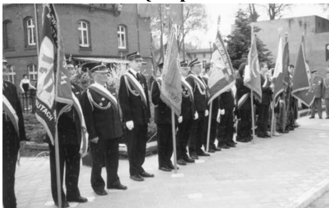
Poczty sztandarowe OSP i prabuckich szkół