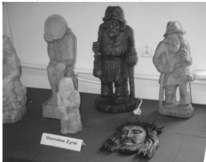
Autentycznie ludowe rzeźbiarstwo Stanisława Żyrka