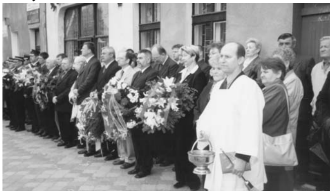
Oficjalni goście i mniej oficjalni widzowie uroczystości