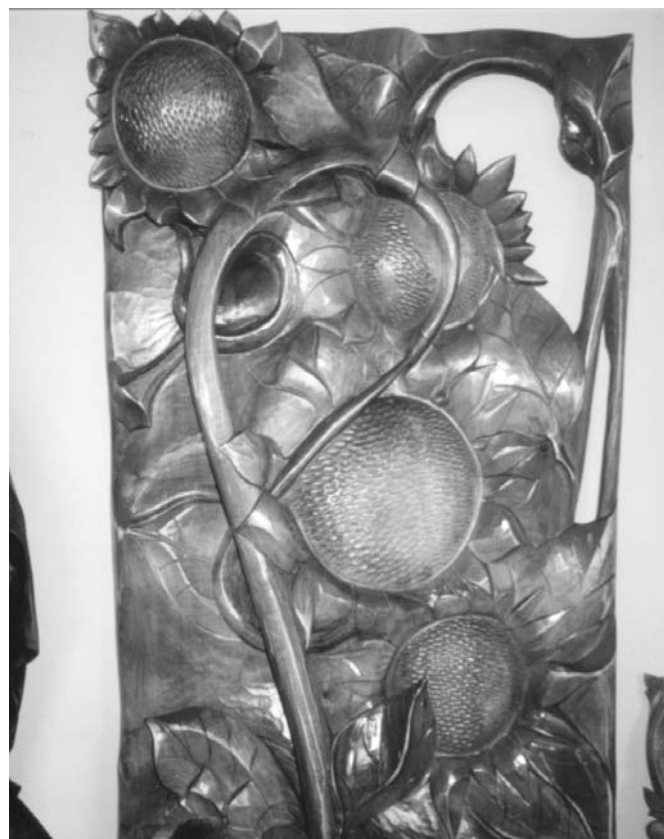
Fragment „Słoneczników” Roberta Konopackiego