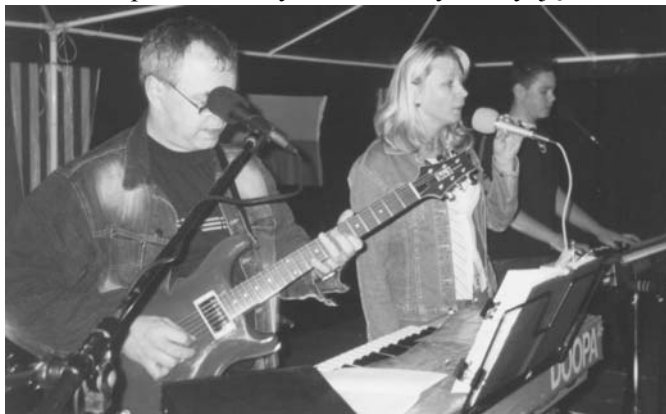
Zespół „Magister Band” tym razem w trio