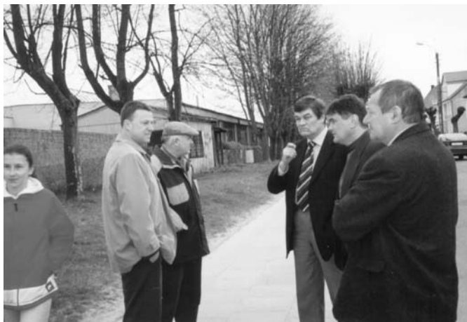
Wjazd do byłych „bąbek” trzeba będzie przenieść na ul. Obrońców Westerplatte.

Podczas wizyty rozważano plany przyszłych rozwiązań komunikacyjnych w rejonie obecnie zamkniętego wylotu ul. Daszyńskiego na trasę Kwidzyn - Iława. W opinii drogowców, dalsze plany poprawy bezpieczeństwa na skrzyżowaniu tej trasy z „obwodnicą” wykluczają przywrócenie ruchu na końcowym odcinku ul. Daszyńskiego, natomiast w celu unormowania ruchu wzdłuż pasaży sklepów sugerowano budowę dużego parkingu w sąsiedztwie budynku GS.