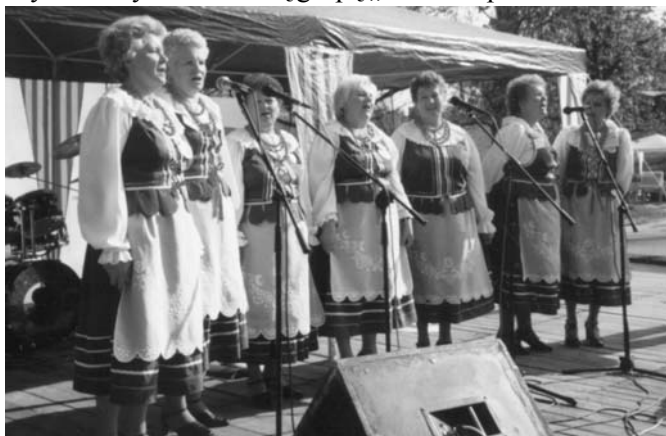
Panie z zespołu „Kwidzynianki” miały kondycję...