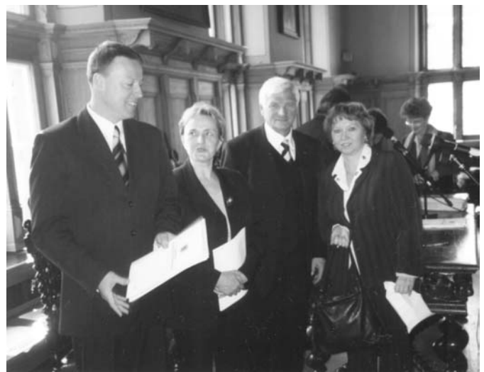
Sygnatariusze umowy tuż po jej podpisaniu

gimnazjów w mieście i gminie Prabuty, poza dotychczasowym Gimnazjum w Prabutach i Zespołem Szkół w Rodowie zastała poszerzona o nową placówkę. Obiekt szkolny, wystarczająco pojemny dla „podstawówki” stał się zbyt mały dla potrzeb kształcenia na dwóch poziomach edukacji. Podjęto decyzję o rozbudowie szkoły i jednocześnie rozpoczęto starania o pozyskanie środków pozabudżetowych na tą inwestycję. Spotkanie w gdańskim Ratuszu zakończyło etap tych starań. Z budżetu Urzędu Marszałkowskiego, a konkretnie z Wojewódzkiego Funduszu Ochrony Środowiska Prabuty uzyskały dofinansowanie w wysokości 50.000 zł z przeznaczeniem na wymianę stolarki okiennej i docieplenie budynku. Wartość całej inwestycji to ok. 150.000zł. Prace zostaną rozpoczęte 1 lipca b.r. a zakończone 20 października.