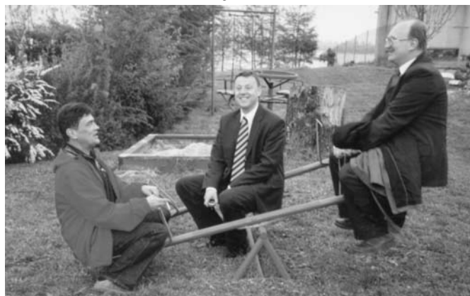
Przy okazji „szychy” odwiedziły Górowychy, czyli Ich Troje na huśtawce (nie wypadało mi być „na górze”) MS